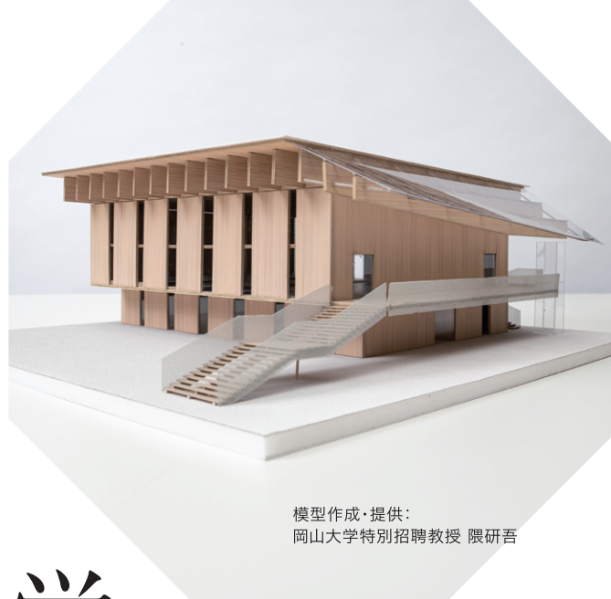
模型作成・提供： 岡山大学特別招聘教授 隈研吾